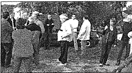
Réunion de quartier, 16 octobre à Pitchat

Le conseil municipal a décidé de tisser des liens très étroits avec la population en l'informant régulièrement, sous différentes formes, de ses décisions et en donnant à celle-ci l'occasion de l'interroger sur tous les sujets, d'exprimer ses remarques et attentes. Chaque samedi, de 9h à 11h, le Maire ou un des 4 adjoints tient, à tour de rôle, une permanence ouverte à tous.