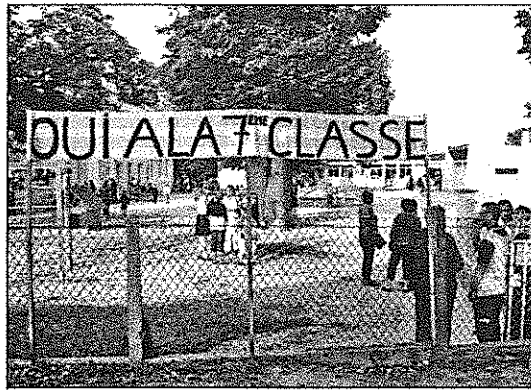
2 septembre 2008, les parents en action.

L'action conjuguée des parents, des enseignants et de la mairie a permis d'obtenir l'ouverture d'une 7 ème classe le 4 septembre.