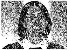
CONSEILLÈRE MUNICIPALE, RESPONSABLE DU CCAS.

Le centre communal d'actions sociales (CCAS) de la commune a un rôle d'accueil, d'écoute, d'information, de soutien et d'aide. Il est constitué à parité d'élus et d'habitants de Loupiac qu'il faut remercier pour leur investissement totalement bénévole.